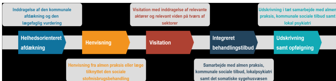
Figur 1: Samarbejde og koordinering i forløbet

Nedenstående figur illustrerer samarbejdsfladerne på tværs af sektorer undervejs i forløbet fra henvisning til visitation og koordinering før, under og efter det integrerede forløb.